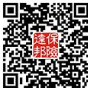
诉讼财产保全责任险